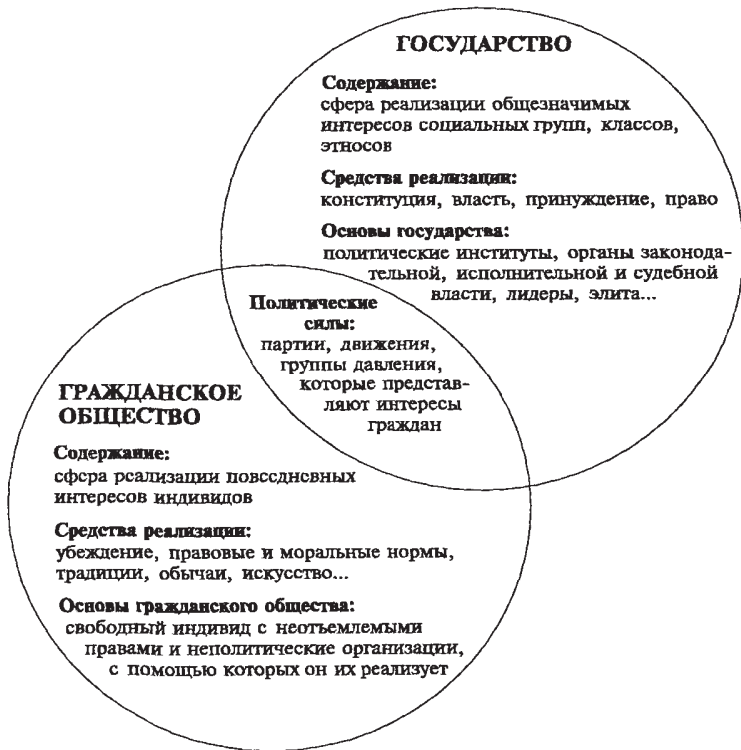
Рис. Государство и гражданское общество

широкой сети жизнеспособных и демократических ячеек гражданского общества является для России вопросом будущего.